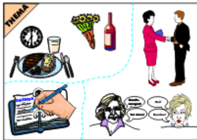
Prent 1. Omgangsvormen

Bij de methode Themis werkt men veel met prenten. De ideeën hiervoor zijn ontleend aan GRAAP (zie 2.1). De prenten zijn bedoeld om associaties op te roepen en emotionele betrokkenheid te versterken en zodoende deelnemers te stimuleren om erover te praten: een participatieve aanpak. Ze functioneren als aanjager om bewustwording op gang te brengen. Hieronder staan enkele voorbeelden.