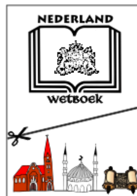
Prent 4. Scheiding kerk en staat