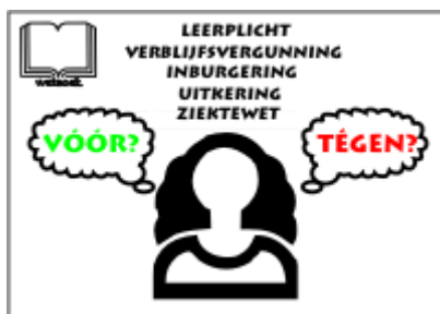
Prent 3. Democratie